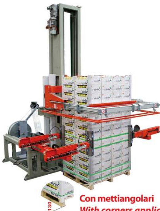
Con mettiangolari With corners application device